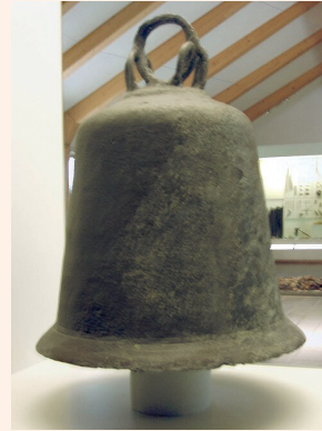
Hedebyklokken fra ca. 950

Ansgar blev efter hjemkomsten fra Birka i 831 udnævnt til ærkebiskop af Hamborg og missionsansvarlig for Norden. I 845 blev byen plyndret og afbrændt af vikinger, og Ansgar måtte flygte, men to år senere blev han ærkebiskop af Bremen og kunne genoptage missionsarbejdet. Omkring 850 fik han kong Horik