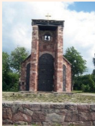
Ansgarkapellet på Björkö

Her i Danmark var det N.F.S. Grundtvig, som for 200 år siden gjorde opmærksom på, at den danske kirke pinsedag 1826 kunne fejre sit 1000-års jubilæum. Grundt-