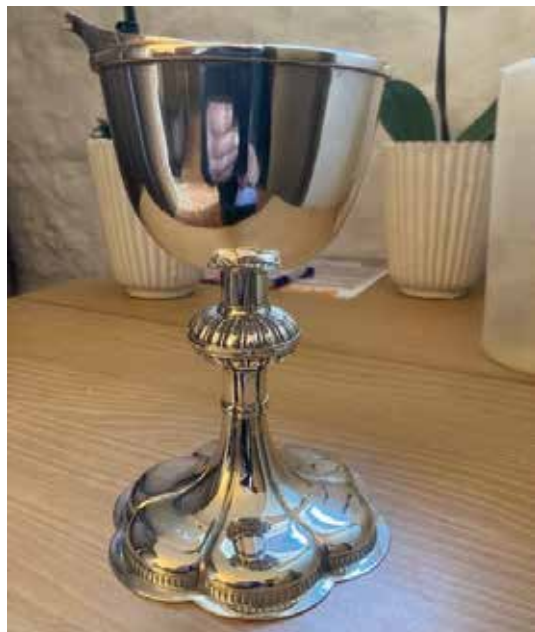
Alterkalk, Jorløse Kirke