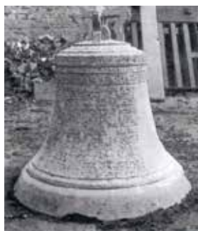
Jorløse Kirkes gamle klokke

"Hør klockens lyd i Jesu navn som minder dig at komme til kirke for dit eget gavn, med troende og fromme kom altid flittig når den sig i tårnet lader ringe, lad ingen ting forhindre dig når du den hører klinge forsøm ej selv din salighed og kirkens sande gode se til du findes vel bered og falder så til fode din Gud og kære frelsermand at du i ham kan finde oprejsning af din syndestand ved troen overvinde."